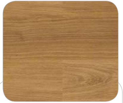
TEKA IL ESSEN