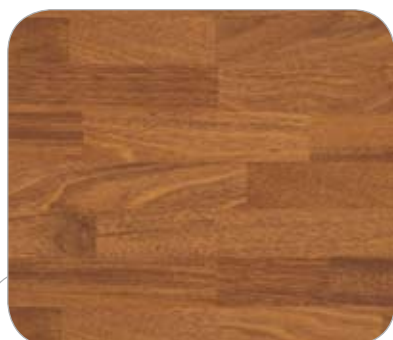
MERBAU 3L VIENA