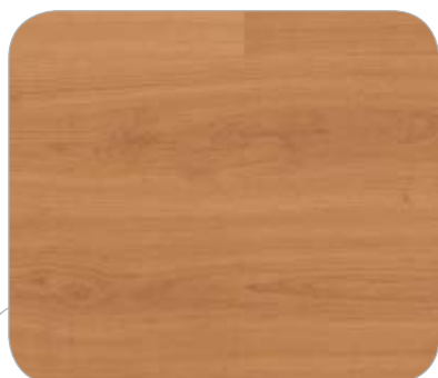
CEREZO IL COLONIA