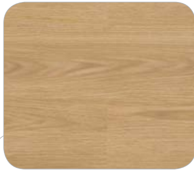
ROBLE IL INNSBRUCK