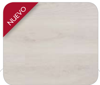
ROBLE BLANCO IL KASSEL