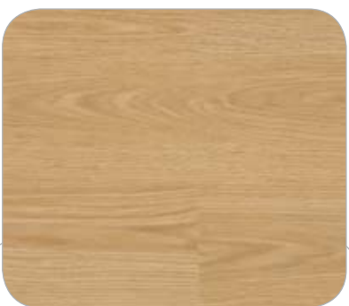
ROBLE IL HAMBURGO