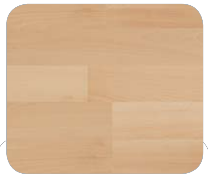
HAYA 2L BONN