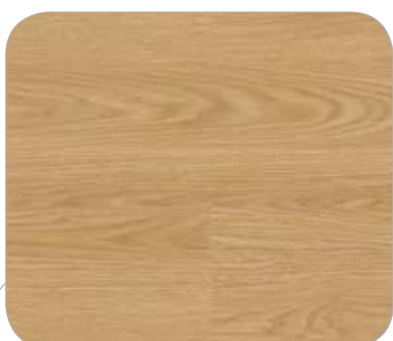
ROBLE IL ALSACIA