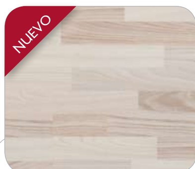
FRESNO BLANCO 3L WEIMAR