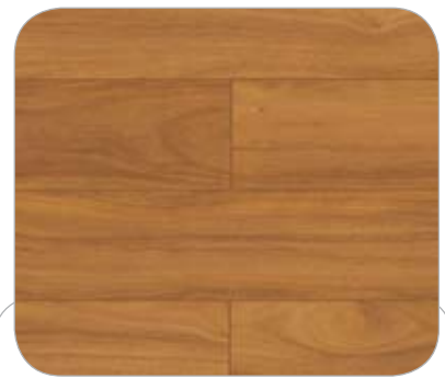
DOUSSIE IL LD