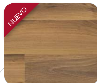
NOGAL ITALIANO 3L COBLENZA