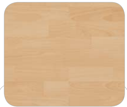
HAYA 3L STRASBURGO