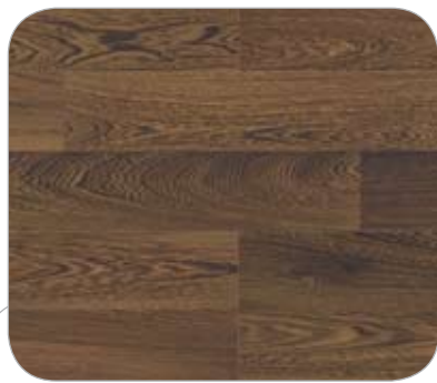
WENGUE 2L WESTFALIA