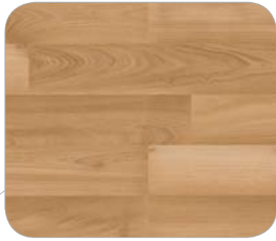
ACACIA 2L BAVIERA