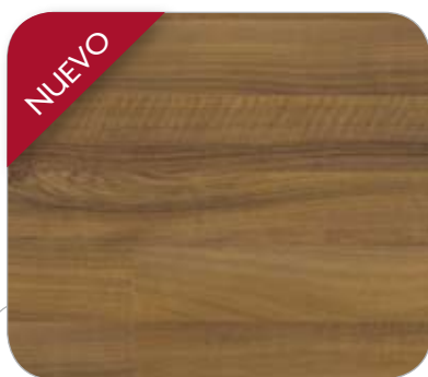
NOGAL SIENA 2L RATISBONA