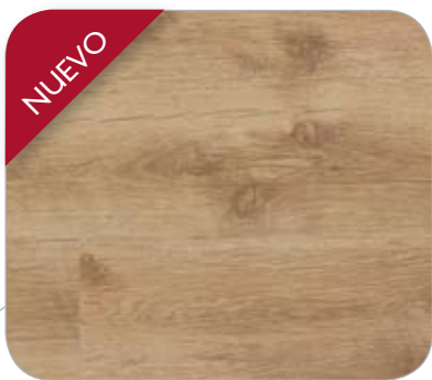
ROBLE RÚSTICO IL DORTMUND