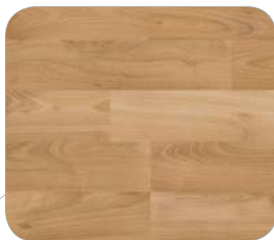
ACACIA 2L FRIBURGO