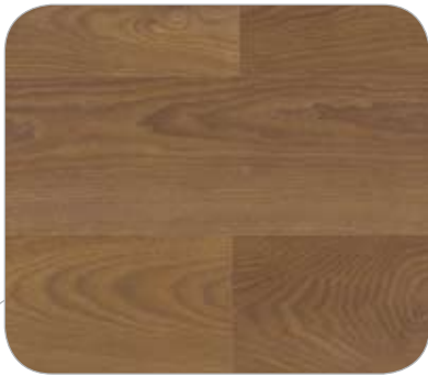
FRESNO IL NUREMBERG