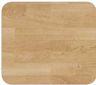
ROBLE 3L MAIN