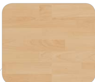
HAYA 3L BERLÍN