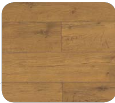
ROBLE IL VINTAGE