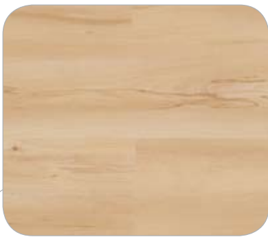
HAYA IL ROSTOCK