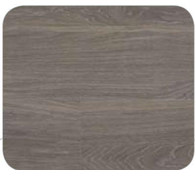
ROBLE DECAPÉ NEGRO