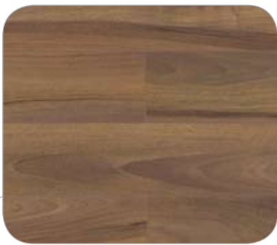
NOGAL IL PERIGORD