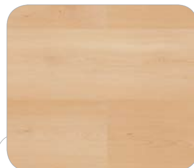
HAYA IL HANNOVER