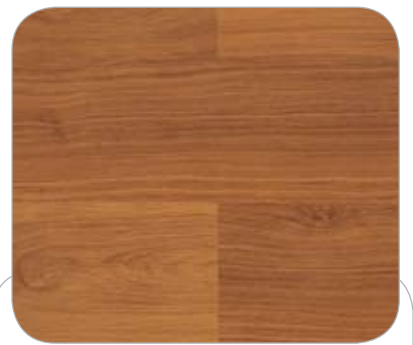
MERBAU IL STTUTGART