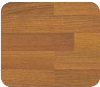
MERBAU 2L LUBECK