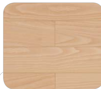
HAYA IL ROYAL