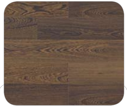
WENGUE 2L HEIDELBERG