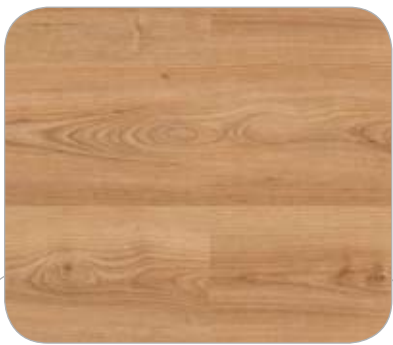
CEREZO IL FRANKFURT