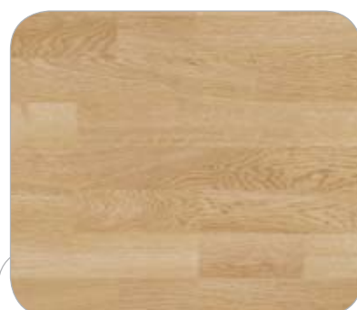
ROBLE 3L MUNICH