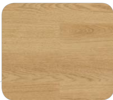
ROBLE IL YORKSHIRE