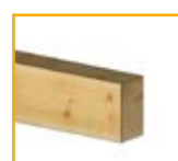
Tipo I: Canecillo Recto