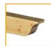
Tipo VIII: Mixto sin escalón