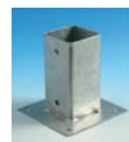
Apoyo de Pilar 14/14