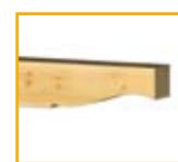
Tipo VI: Contorneado