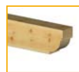
Tipo V: Cóncavo