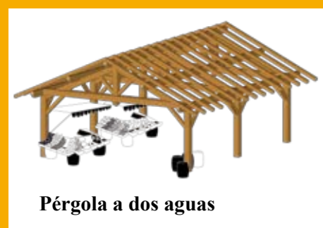
Pérgola a dos aguas