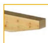
Tipo II: Corte Oblicuo