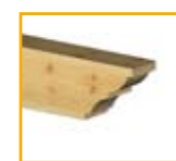
Tipo VII: Mixto