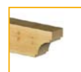
Tipo IV: Convexo