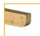
Tipo III: Redondeado