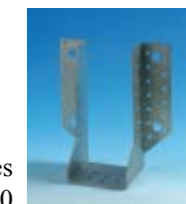
Estribo Alas Exteriores 80/100