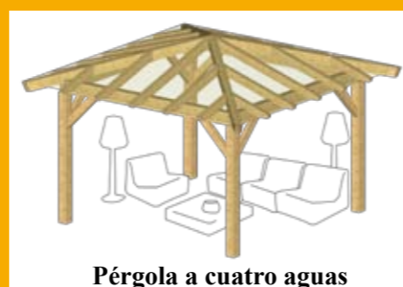
Pérgola a cuatro aguas